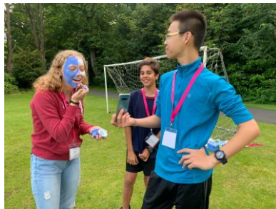
▲ 迷你奧林匹克競賽