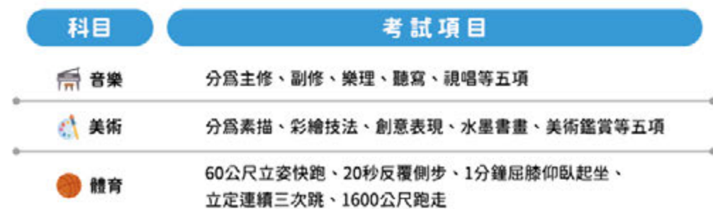
表三、術科考試科目及考試項目