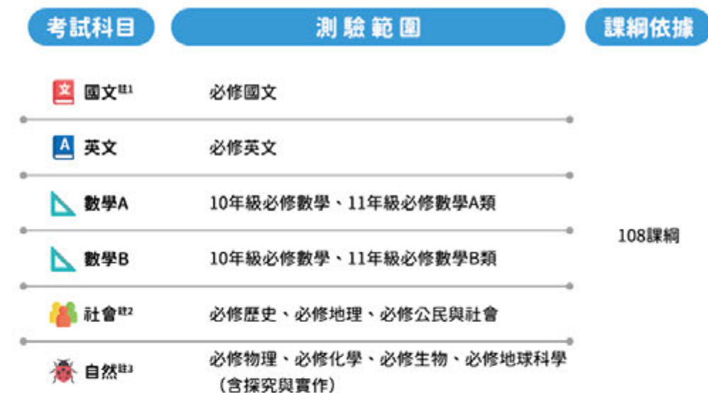
表一、學科能力測驗的測驗範圍