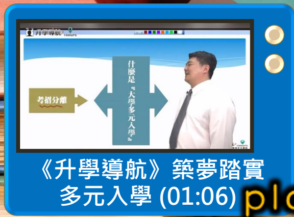
《升學導航》築夢踏實 多元入學 (01:06) play

「特殊選才」、「繁星推薦」、「個人申請」及「考試分發」這四種主要的大學多元入學管道各自訴求不同的選材方式，因此除了成績之外，更要考慮自己的個性與能力優勢適合何種管道。